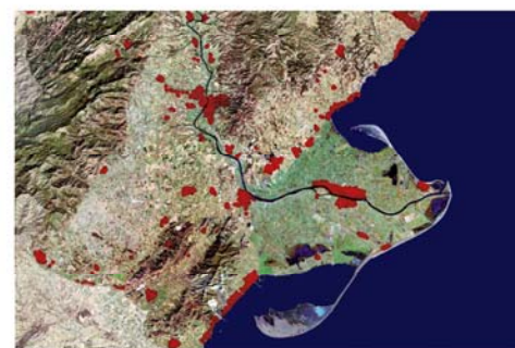
Escala 1:350 000